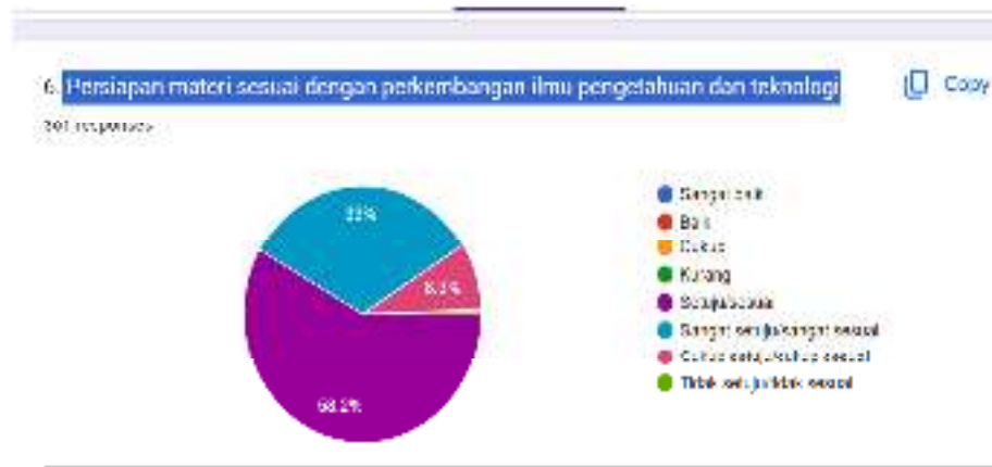
Gambar 4. Respon Pembelajaran Terhadap persiapan materi

Tingkat kepuasan mahasiswa Program Studi Agribisnis terhadap kepedulian dan daya tanggap dosen dalam melaksanakan perkuliahan. Tanggapan kepuasan mahasiswa terhadap Kemampuan dosen memfasilitasi kegiatan pembelajaran dengan baik mencapai 58,4 % yaitu katagori Sesuai atau setuju. Tanggapan kepuasan mahasiswa terhadap dosen memberikan latihan soal, tugas, dan kuis sesuai dengan pembelajaran 57, 9 %. Tanggapan kepuasan mahasiswa terhadap Dosen memberikan waktu untuk berdiskusi dan tanya jawab 55,7% atau dalam katagori Sesuai/Setuju.