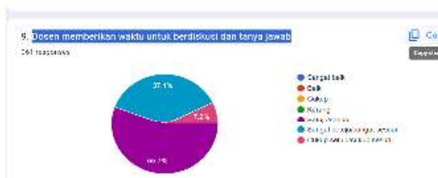
Gambar 5. Respon Pembelajaran Terhadap waktu

Tingkat kepuasan mahasiswa Program Studi Agribisnis terhadap kepedulian dan daya tanggap dosen dalam melaksanakan perkuliahan. Tanggapan kepuasan mahasiswa terhadap Kemampuan dosen memfasilitasi kegiatan pembelajaran dengan baik mencapai 58,4 % yaitu katagori Sesuai atau setuju. Tanggapan kepuasan mahasiswa terhadap dosen memberikan latihan soal, tugas, dan kuis sesuai dengan pembelajaran 57, 9 %. Tanggapan kepuasan mahasiswa terhadap Dosen memberikan waktu untuk berdiskusi dan tanya jawab 55,7% atau dalam katagori Sesuai/Setuju.