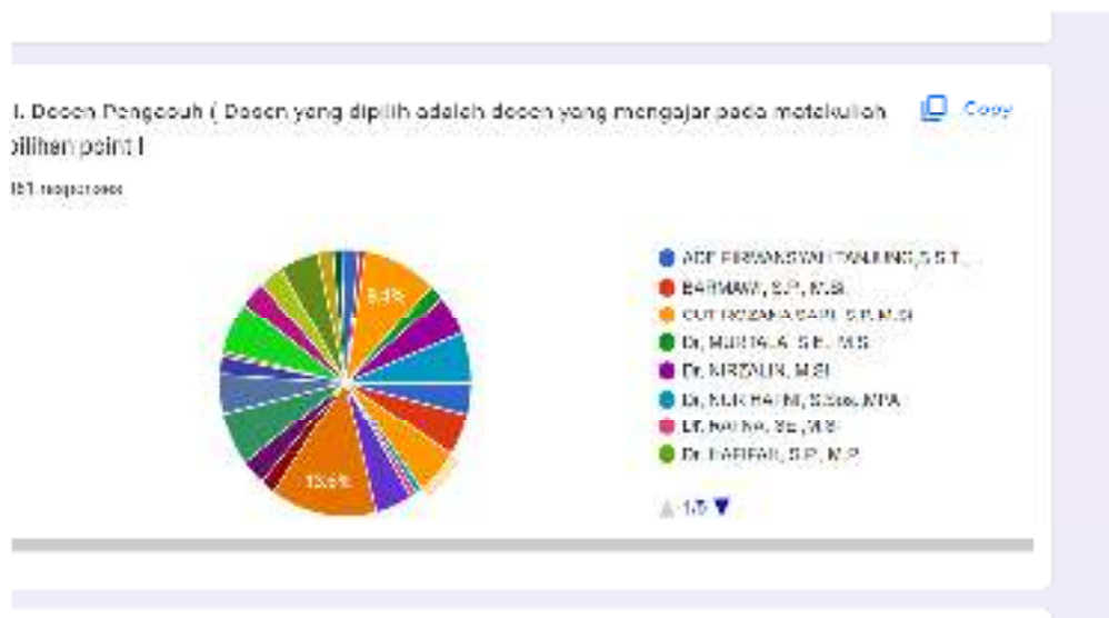
Gambar 2. Respon Mahasiswa Terhadap Dosen

Evaluasi tingkat kepuasan mahasiswa terhadap pembelajaran dilakukan melalui penyebaran formulir kuesioner secara online di akhir semester. Adapun hasil evaluasi tersebut dapat dilihat pada Gambar 1